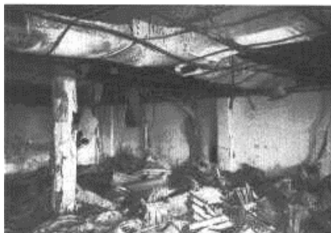
Zničená bádatelňa v Bagdade

zamedzenie deštruktívnych zdrojov a zahrňujúce odporúčania pre vlády, ktoré doposiaľ nepodpísali Haagsku konvenciu z roku 1954 o ochrane kultúrneho dedičstva počas vojenského konfliktu. Výzva bola adresovaná aj k Organizácii spojených národov a ďalším medzinárodným organizáciám, ktoré by mali zahrnúť ochranu dokumentov do svojich humanitárnych a mierových operácií.